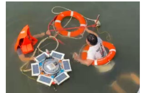
マニラ湾へのブイの投入