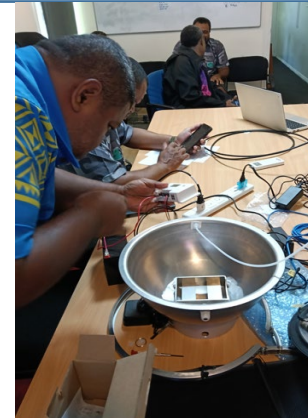
フィジーでのブイ組み立てトレーニング