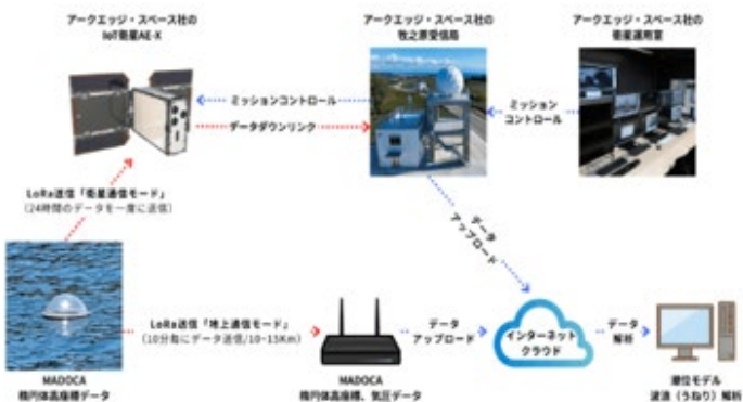
MADOCA-PPPとIoT衛星活用のコンセプト