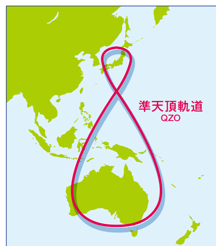
主要な利用可能地域 Main area where QZSS is available

The QZO has an added eccentricity and has north-south asymmetry. Satellites move at a slower speed in the smaller half of the figure eight, remaining there for a long period of time.