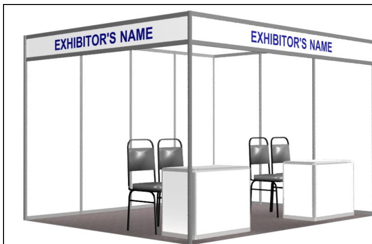
Sample photo of the booth

Supply of booth shell with following components per booth: