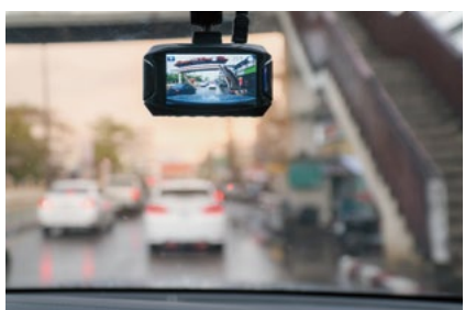
ドライブレコーダー