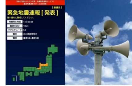
メッセージ機能 左画面